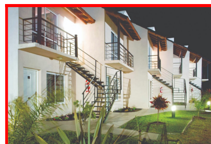
BRISAS DEL LAGO