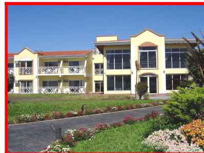
COSTA DEL SOL