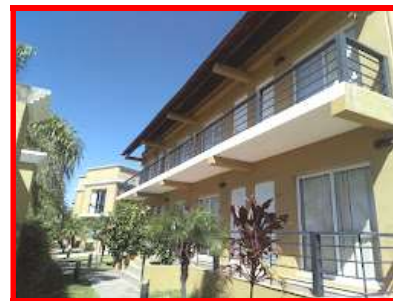
BRISAS DEL LAGO