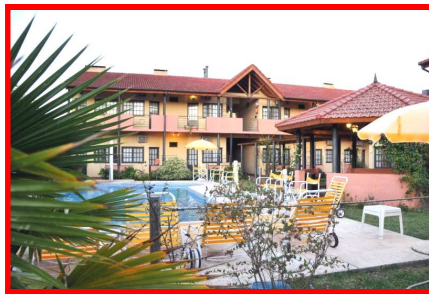
HOSTA LA CLORIETA