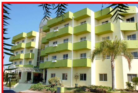
APART HOTEL FEDERACION